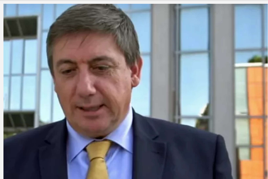
...Jan Jambon: nagelaten het FANC grondig bij te sturen...

Na een eerdere audit twee jaar geleden bevestigt volgens de krant La Libre Belgique een tweede intern onderzoek de interne problemen bij het FANC: gebrek aan visie, gebrek aan respect voor de aanwervingsprocedures en gebrek aan samenwerking tussen de directeurs.